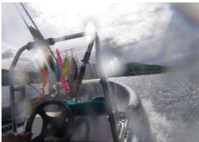
Auf dem riesigen Fjord wird's bei Wind schnell ungemütlich