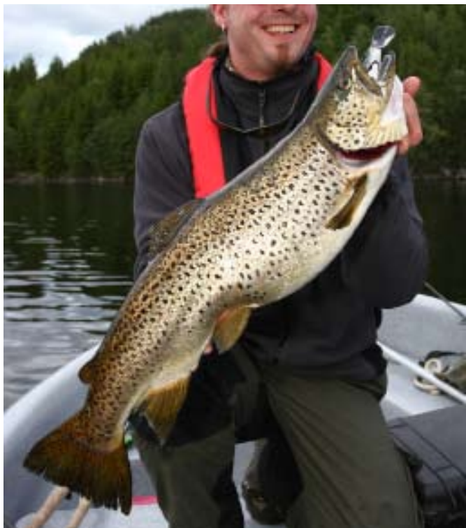
Bullige Überraschung: acht Pfund wog die 66er Seeforelle