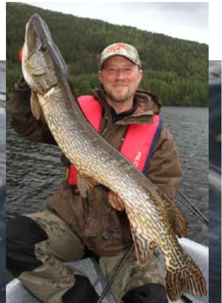
Perfekt zum Abfischen der Kanten und beliebt bei den Kröderfjord-Räubern – Bull Dawgs und ihre Verwandten