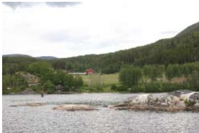
Weit Weg vom Ferienhaus, aber gut – die Felsen bei Veikåker