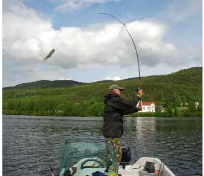
Anstrengend, aber erfolgreich – das Werfen mit Bull Dawgs

Also, im Flachen nur kleine und im Freiwasser gar keine Hechte – bleiben die Kanten. Und die waren es dann auch. Die Hechte hielten sich