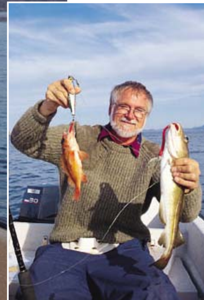
Der Blick auf die Seekarte hat sich gelohnt: schöner Rotbarsch, prima Küchendorsch.