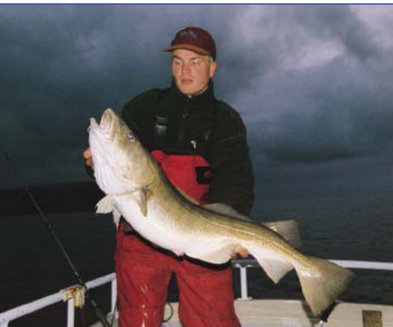
Solche „Klopper“ gehen zwar nicht jeden Tag an den Haken, sind aber immer möglich.