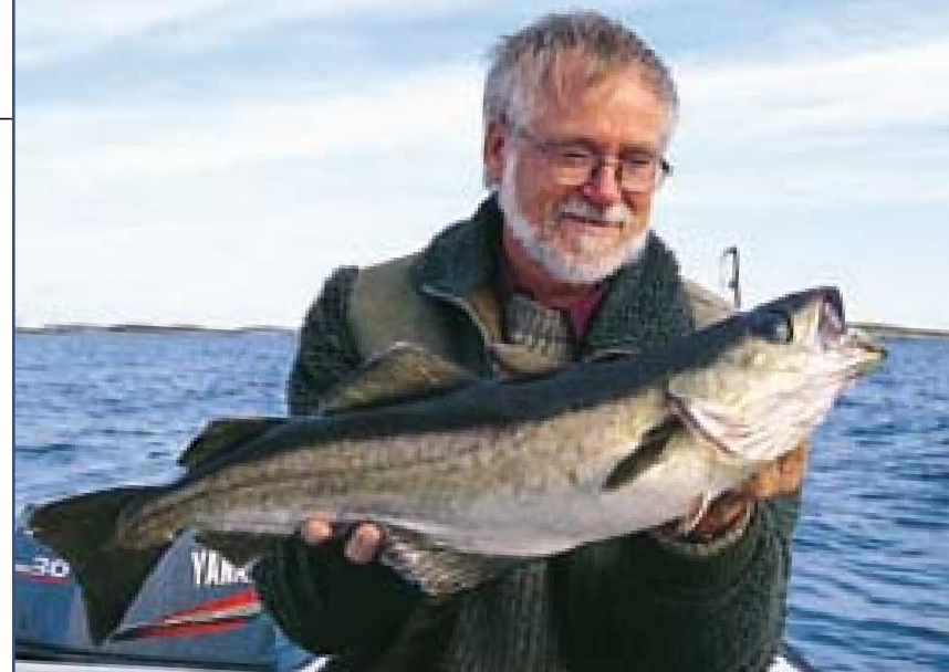
Köhler sind in allen Tiefen anzutreffen. Am ehesten jedoch im Mittelwasser.

Die Wattwürmer übrigens, die wir nur 300 Meter von Bakkan Wahl entfernt mit der Forke ausgruben, waren so groß, wie ich sie noch nie gesehen hatte.