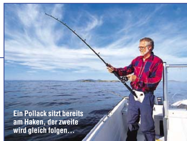
Ein Pollack sitzt bereits am Haken, der zweite wird gleich folgen...