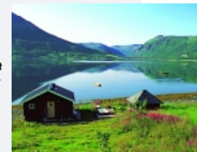
Die Landschaft am Nordkap ist wie eine Mischung aus Tundra und Mittelgebirge - von eigenartig kühler Schönheit.