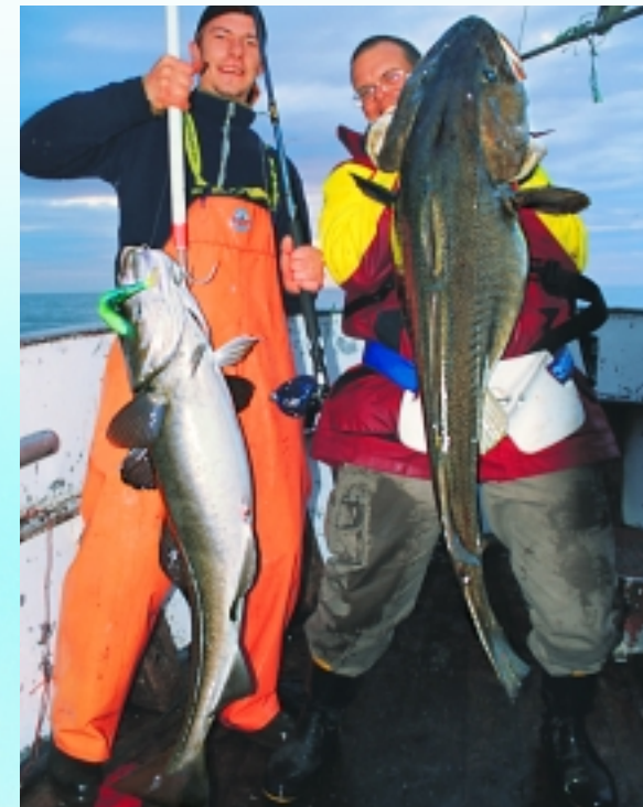
Solche Dorsche hält der hohe Norden für seine Besucher bereit.

nach Möglichkeit die Fahrinne der Fähre, bis man eine etwa 70 m tiefe Rinne erreicht, stellt den Motor ab und fängt an zu pilken.