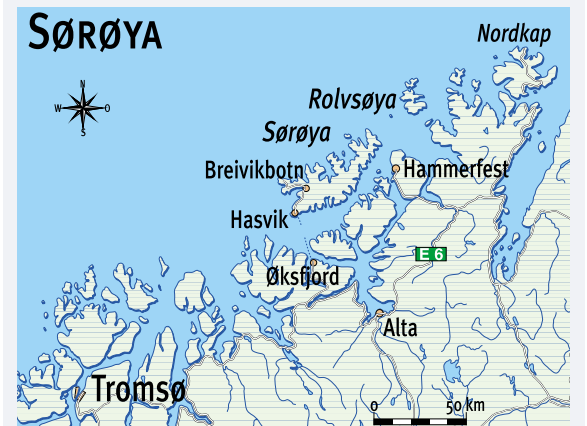
Das Nordkap liegt praktisch „in Wurfweite“...