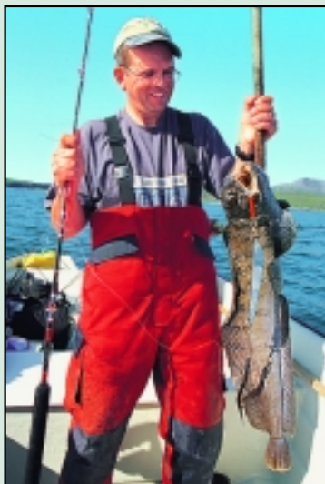
Steinbeißer am Svenskepilk.